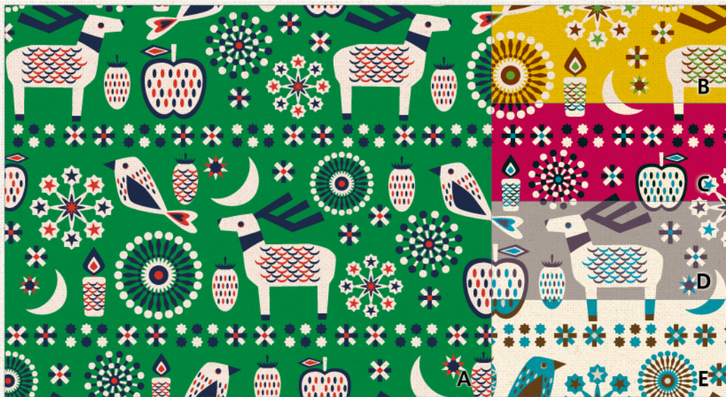
‘Twinkling’ (トゥインクリング) | 素材: オックス / cotton 100% | CO152158 (画像縮尺: 原寸 x 50%) 瞬く星と月、キャンドル、愛らしいオーナメントのような鳥とトナカイ、木の実に雪の結晶...、キラメキをまとったモチーフたちが、素朴でどこか懐かしいあたたかみを感じさせてくれる絵柄です。ホームアイテムにもおすすめなオックス生地。