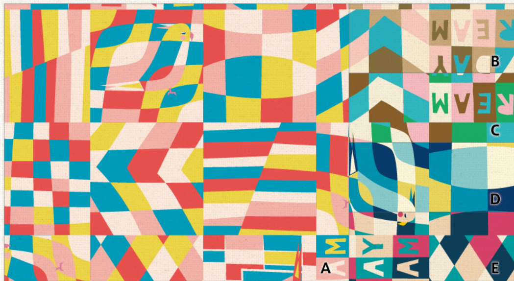
‘Day Dreamer’ (デイドリーマー) | 素材: シャーティング / cotton 100% | CO822161 (画像縮尺: 原寸 x 50%) うたた寝インコの見るカラフルな白昼夢。鳥の姿とともに継ぎ合わされたモザイク模様が、ファンタスティックな想像力をかきたてます。扱いやすい厚みのシャーティング地で、パッチワークから洋服、袋物まで幅広くご利用いただけます。